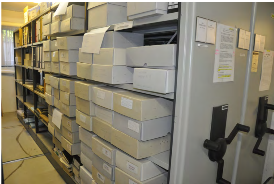
Rollregalanlage im Magazinraum