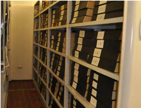
Bände der Uetersener Nachrichten (1949–2015)