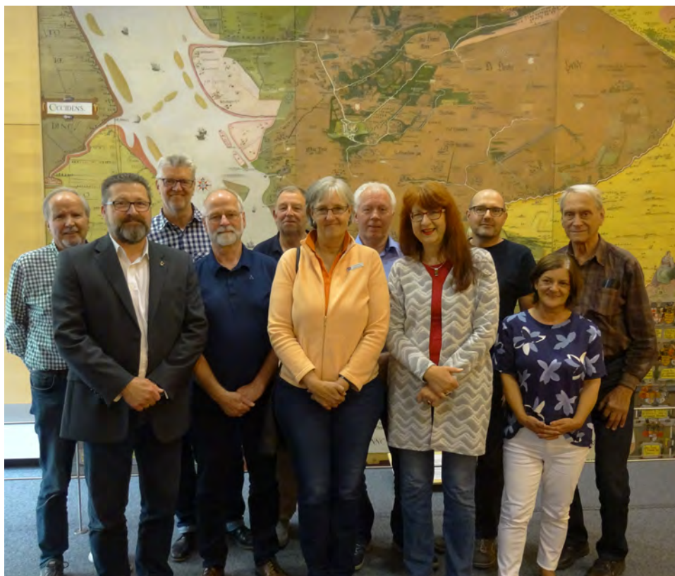
Mitglieder der Archivgemeinschaft im Kreis Pinneberg 2019