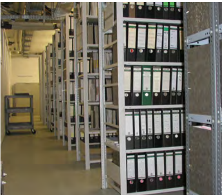
Archiv des azv: Bauakten

Die Bestände umfassen Urkunden, Dokumente und Akten aus der Geschichte des Klosters seit seiner Gründung sowie Zeugnisse aus der Zeit der „Klösterlichen Obrigkeit“ seinerzeit für den Flecken Uetersen und die zugehörigen Dörfer wie Horst, Seester, Kurzenmoor, Heist u.a.