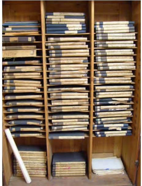
Originaler Aktenschrank der Firma Wupperman

Auch die von der Geschichtswerkstatt im Laufe von über 20 Jahren zusammengetragenen Informationen in Form von Interviews, Fotos Zeitungsartikeln und Kopien von Archivalien aus verschiedenen in- und ausländischen Archiven befinden sich hier.