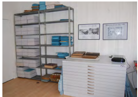
Blick in den provisorisch als Archiv eingerichteten Raum im Jugendzentrum Uetersen

Auch wenn das Archiv noch in den Kinderschuhen steckt, können gern Anfragen gestellt werden; auch eine gewünschte Akteneinsicht kann gewährt werden.