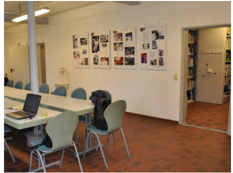
Benutzerraum mit Blick in den Magazinraum