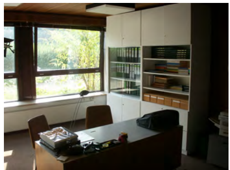
Archivraum im Untergeschoss der Sporthalle Schenefeld

Das Stadtarchiv wurde 1981 als reines Verwaltungsarchiv von Frau